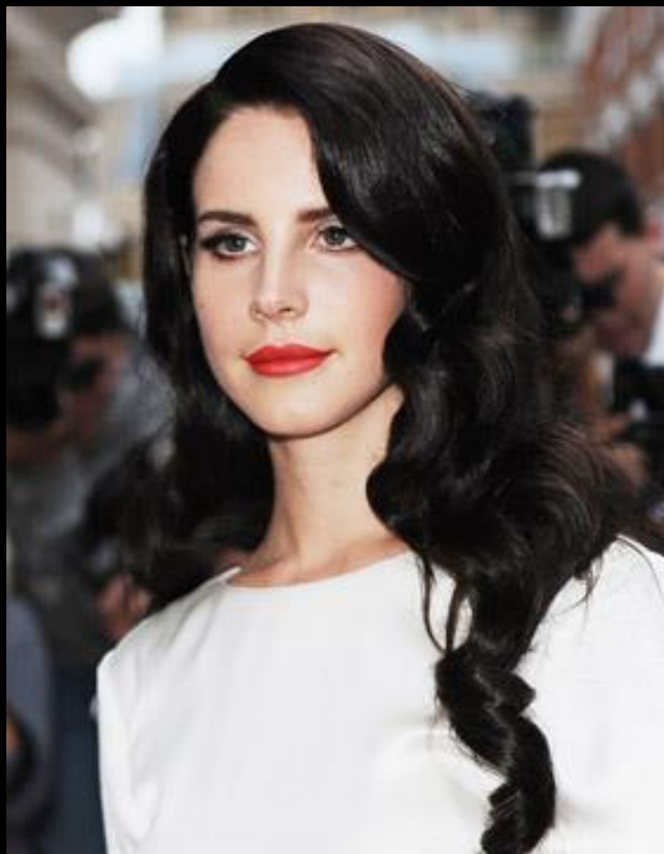
Lana del Rey