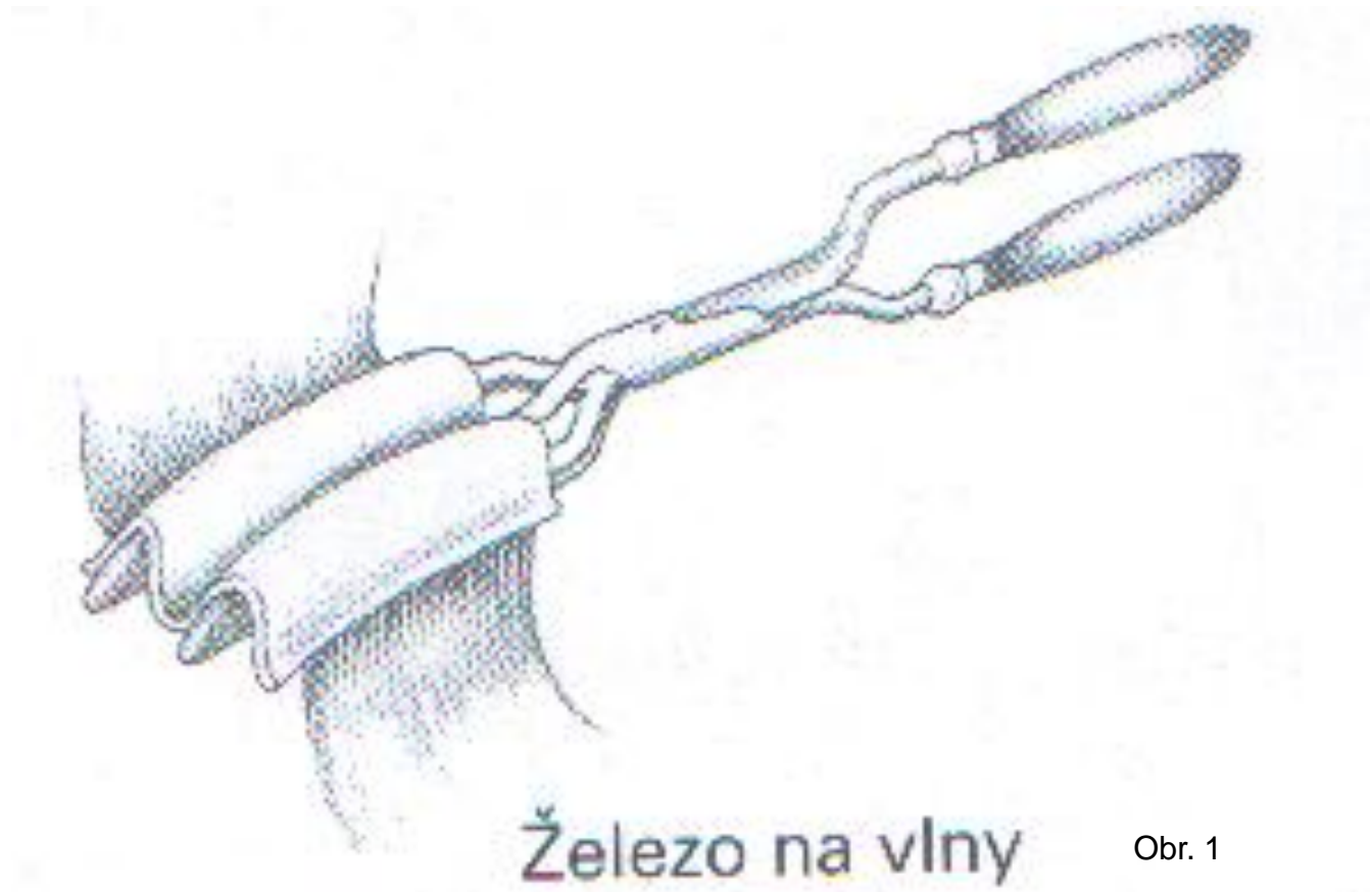
Železo na vlny