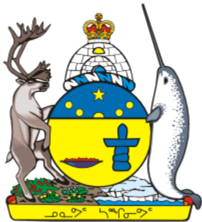
Obrázek 2 Coat of Arms of Nunavut