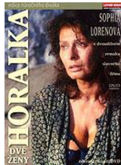
verze z r. 1988 (obr. 4)