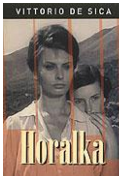
verze z r. 1960 (obr. 3)